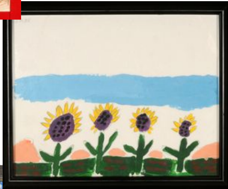
Sunflowers Thomas Turnbull, Owen Sound Acrylique sur carton mat